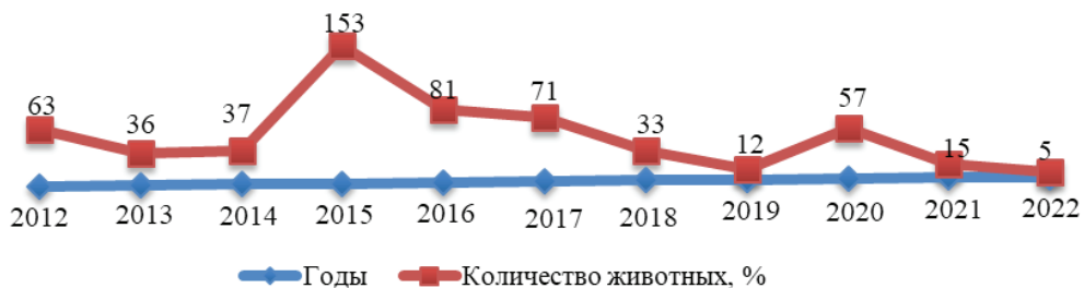
Рисунок 3 – Количество случаев заболевания бешенством в период с 2012 по 2022 годы

Выводы. Выявлены эпизоотические особенности проявления бешенства в Ярославской области: