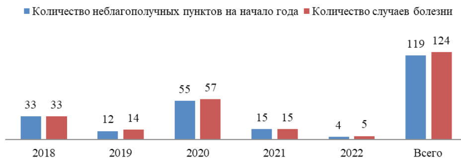
Рисунок 1 – Эпизоотическая ситуация на территории Ярославской области по заболеванию бешенством за 2018–2022 годы

ном очаге, был максимальным в 2022 году – 1,25, минимальный наблюдался в 2018, 2019 и 2021 годы – 1.