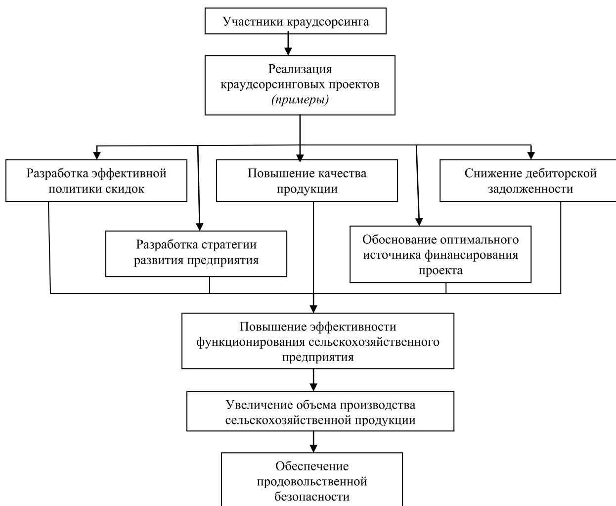
Рисунок 1 – Схема влияния участников краудсорсинга на обеспечение продовольственной безопасности

Зарубежный опыт использования краудсорсинга свидетельствует о его универсальности и эффективности. Так, с помощью данной технологии можно решать обширный круг задач во всех сферах экономики. Самый известный пример